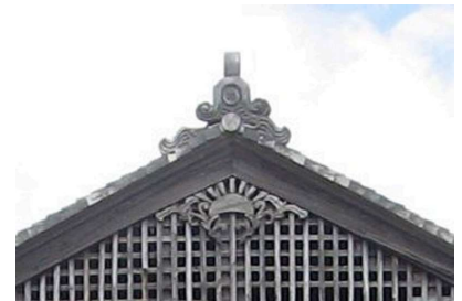
写真2 朝日の形の懸魚