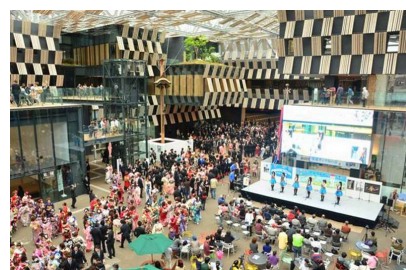
写真1 アオーレ長岡で開催された 成人式の様子 (長岡市中心市街地整備室提供)