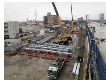
写真1 鉄骨ストックヤード