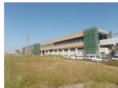
写真3-① 外部足場解体状況