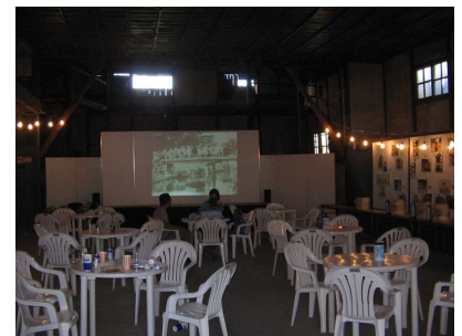
写真3 内部活用の様子