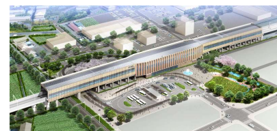
図1 新高岡駅鳥瞰図