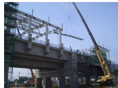
写真2 鉄骨建方状況