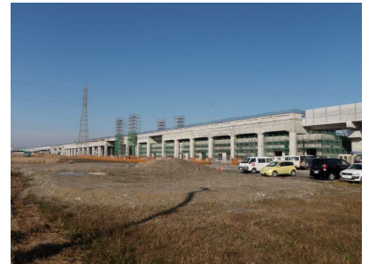
写真3-③ 外部足場解体状況