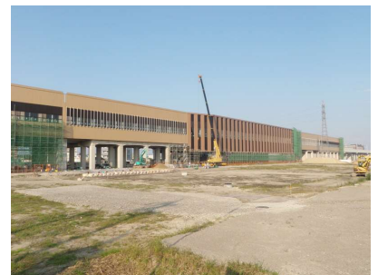
写真3-② 外部足場解体状況