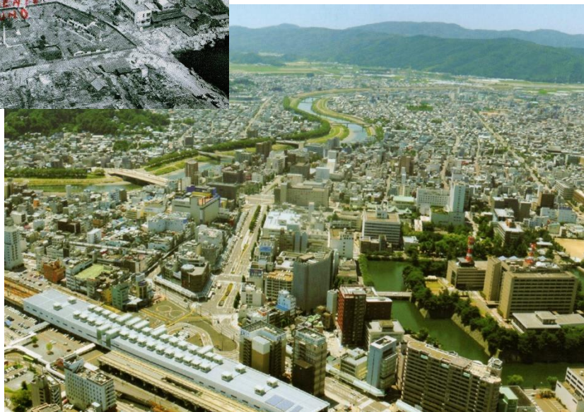
福井市中心部（県都デザインフォーラム：福井県・福井市 2011）